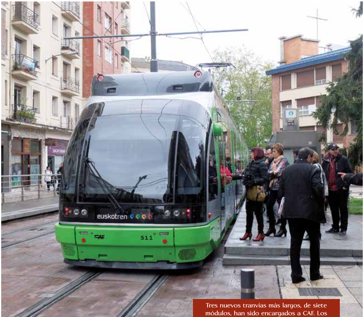
Tres nuevos tranvías más largos, de siete módulos, han sido encargados a CAF. Los actuales cuentan con cinco módulos.