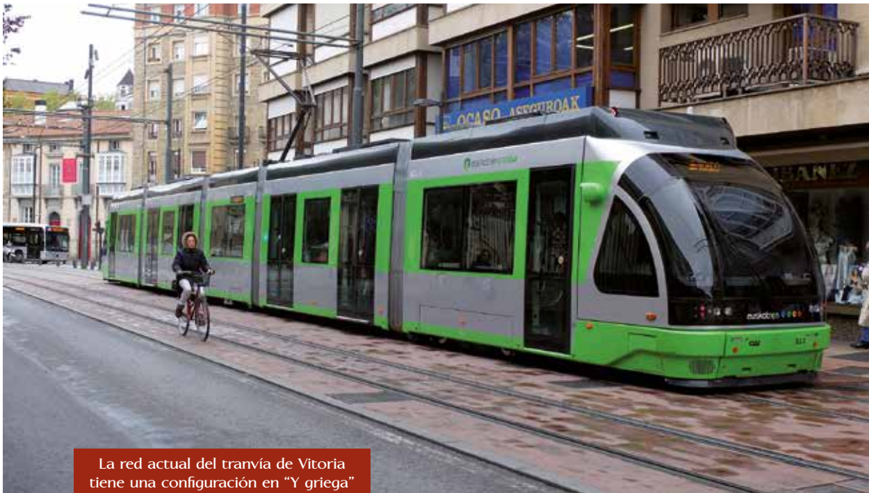
La red actual del tranvía de Vitoria tiene una configuración en “Y griega” con aproximadamente 7,5 kilómetros.

El servicio, operado por Euskotren, se realiza con una frecuencia de cuatro vehículos/hora, es decir, con frecuencias de servicio de 15 minutos en ambas líneas Ibaiondo-Angulema y Abetxuko-Angulema. Ambas comparten el tramo común Honduras-Angulema, en el que se concentra la mayor demanda, lo que hace que el intervalo en este tramo sea de 7,5 minutos (u ocho vehículos/hora).