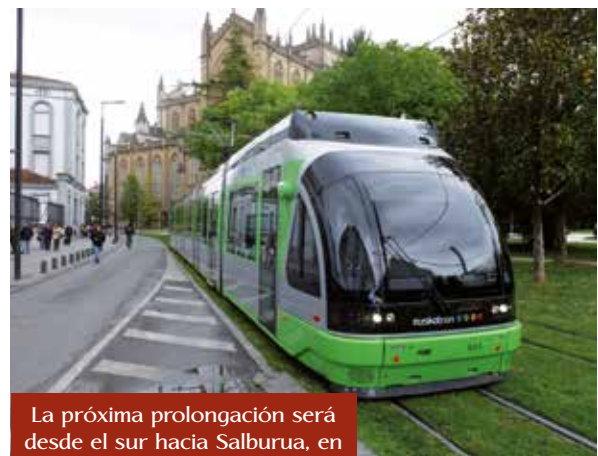
La próxima prolongación será desde el sur hacia Salburua, en el este de la ciudad.